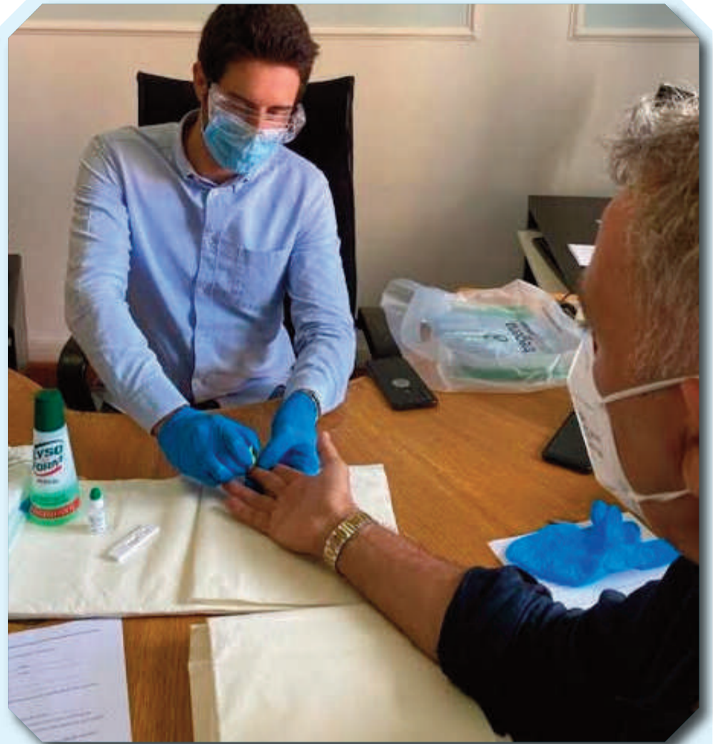
L'Amministrazione Comunale di Nemi nell'ambito dell'emergenza Covid ha voluto garantire la salute dei propri dipendenti di poter effettuare il test sierologico rapido Covid. Tutto è avvenuto grazie alla collaborazione dell'azienda "3 Gamma" che ha fornito i test rapidi combinati Covid-19 i quali hanno una attendibilità del 95,02% e anche dal laboratorio analisi Secural Srl.